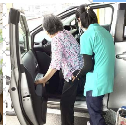
車の乗り降り練習