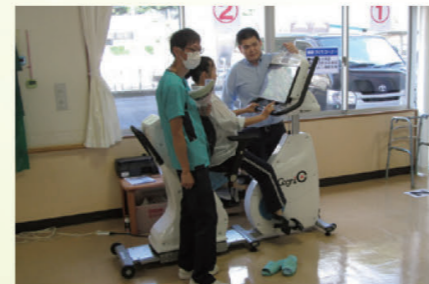
リハビリ機器体験