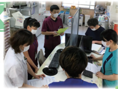
カンファレンス(会議)

老健では、各職種が専門性を発揮しながら、医療や保健、介護など、職種の垣根を超え、チームとして利用者にサービスを提供します。これを多職種協働といいます。各専門職の立場に上下(ピラミッド型)はなく、利用者を中心にし、円で囲むように手を取り合って体制づくりをする(ドーナツ型)イメージです。