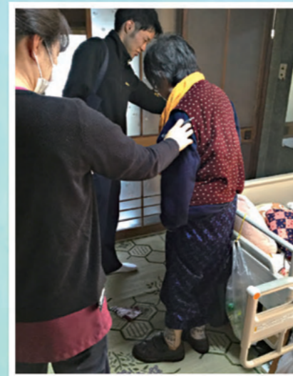
生活動作の確認・ 介助方法の検討