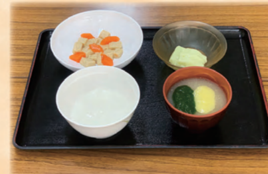
飲み込みを考慮した食形態 (ムース食：嚥下調整食3)