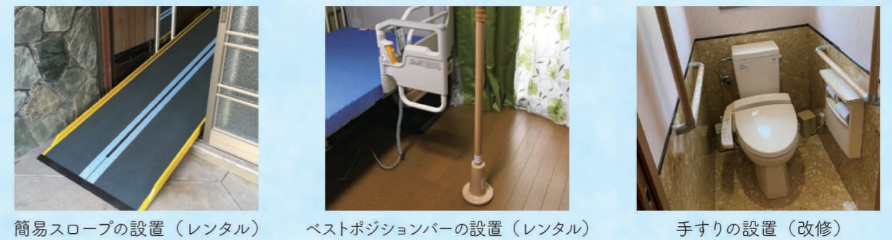
簡易スロープの設置（レンタル）