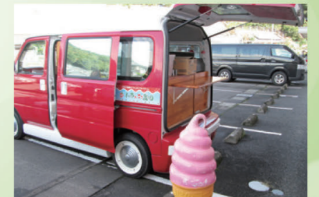
ソフトクリーム販売

延岡市より「【新型コロナウイルス対策】自宅でも出来る体操・レクリエーション・楽しい時間の過ごし方アイデア募集」にて優秀賞を受賞しました。