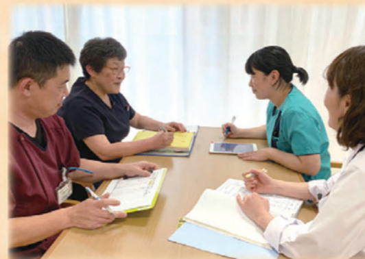
多職種による会議

高齢になると徐々に食べる量が減ってしまい、口から物をうまく食べられなくなってしまうことがあります。当施設ではたくさんの職種によって「利用者様が口から食べ続ける」と言う事に対する支援を行っています。