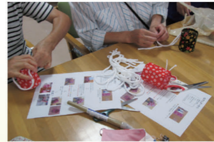
認知症予防の工作教室