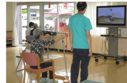
リハビリ機器による体操