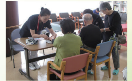
身体測定・健康介護相談