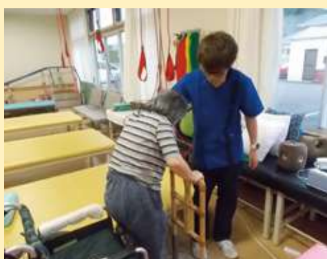
立ち上がり動作訓練