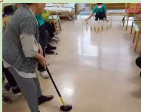
パターボーリング