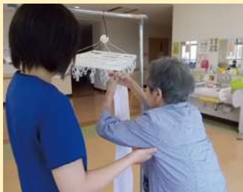
洗濯物干し動作訓練