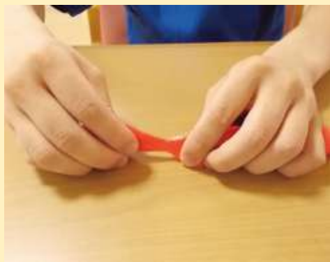
箸の握り動作訓練