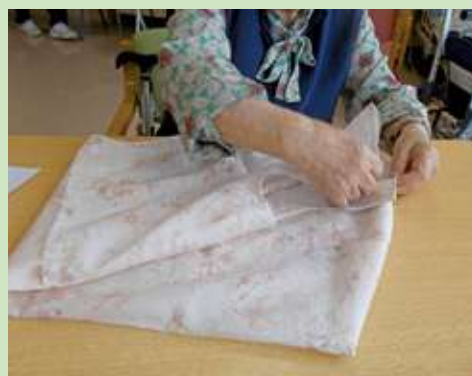
エプロン早たたみ競争