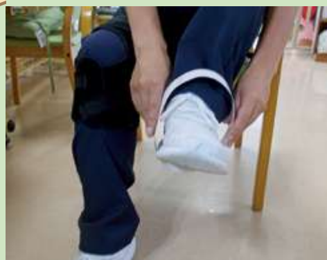
わっかとおし競争