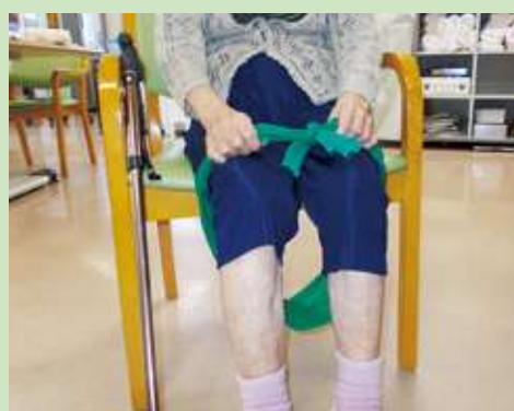
わっかくぐり競争